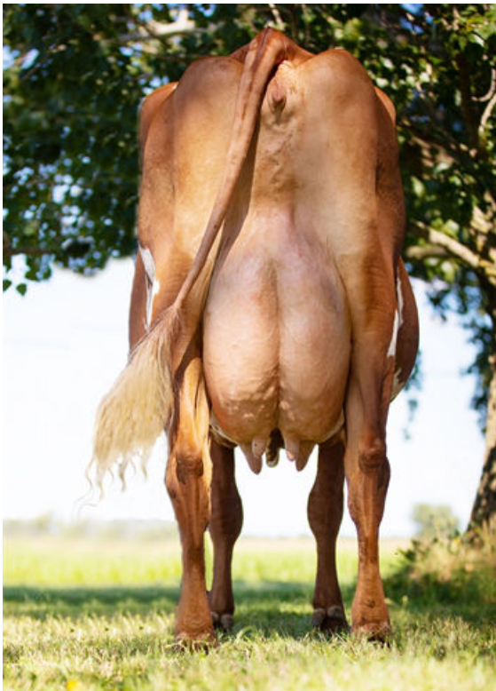
MARBRAE ARBITER'S CATALINA GRANDDAM